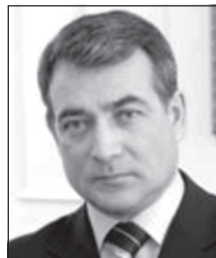
Михаил Иванцов, глава администрации г. Тулы