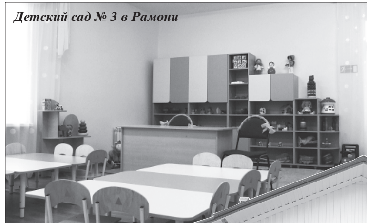
Детский сад № 3 в Рамони

Материал подготовил Юрий ПОШАТАЛОВ, зам. главного редактора «ЭЖ-Черноземье»