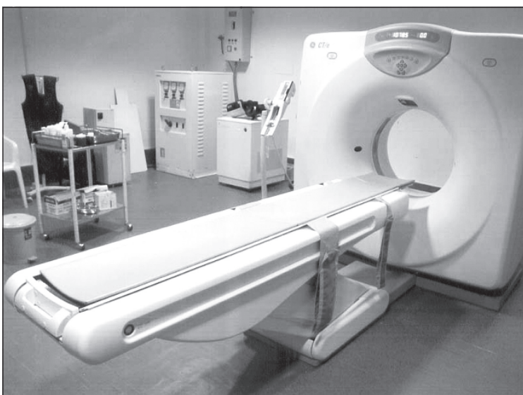
«РосМедТехнолоджи-Липецк» будет производить сырье для позитронно-эмиссионной томографии

Роман ТРУБНИКОВ, обозреватель «ЭЖ-Черноземье»