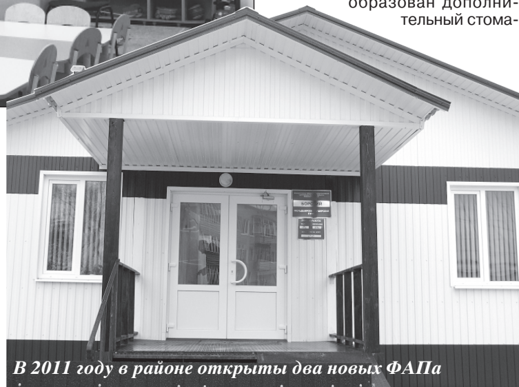
В 2011 году в районе открыты два новых ФАПа

– В прошлом году мы построили два новых фельдшерско-акушерских пункта – в селе Глушицы и поселке Бор, капитально отремонтировали Новожиновскую участковую больницу и 4-й этаж районной поликлиники – там разместилось стоматологическое отделение. Вместе с пятью ФАПами, введенными в эксплуатацию в 2010 году (села Ступино, Нелжа, Горожанка, Богданово, пос. Комсомольский), это стало хорошим подспорьем для сельской медицины. Все введенные объекты на 100% укомплектованы новейшим оборудованием и мебелью – за два года на перечисленные объекты было израсходовано из районного бюджета 21 млн руб. и 6,2 млн руб. – в рамках муниципально-частного партнерства. Еще 6,8 млн рублей район получил в 2011 году по федеральной программе модерни-