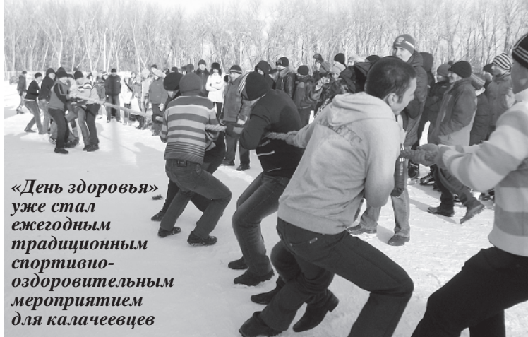
«День здоровья» уже стал ежегодным традиционным спортивно-оздоровительным мероприятием для калачеевцев

При этом любой проект, большой или малый, обязательно находит поддержку со стороны органов местного самоуправления, если он направлен на повышение экономического потенциала Калачеевского района, развитие социальной сферы, создание новых рабочих мест, повышение качества и уровня жизни калачеевцев.