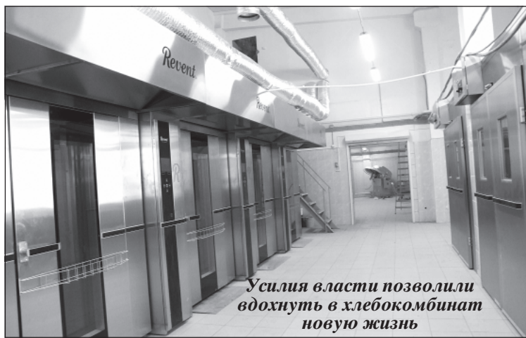
Усилия власти позволили вдохнуть в хлебокомбинат новую жизнь

В Калачеевском районе осуществляется модернизация существующих и планируется создание новых перспективных производств