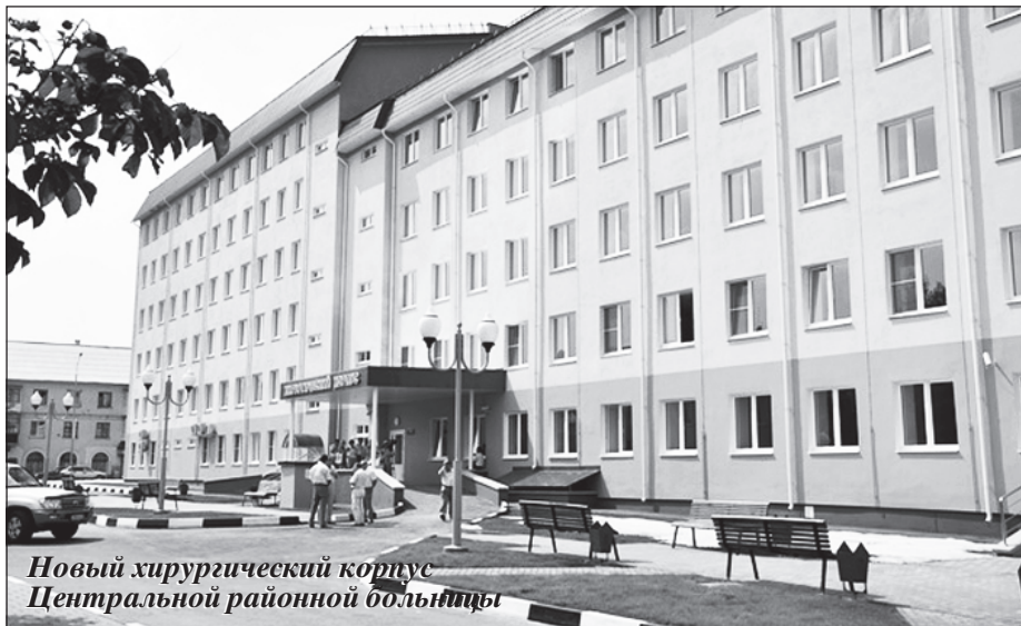
Новый хирургический корпус Центральной районной больницы

Реализуя Стратегию социально-экономического развития Губкинского городского округа до 2025 года, мы особое внимание уделяем открытости власти, ее доступности для населения, применяя при этом самые разнообразные формы сотрудничества. Все эти формы взаимодействия позволяют органам местного самоуправления проводить эффективную социально-экономическую политику, формировать в обществе атмосферу доверия и понимания.