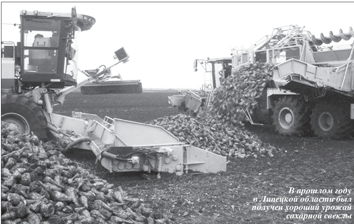
В прошлом году в Липецкой области был получен хороший урожай сахарной свеклы

Роман ТРУБНИКОВ, обозреватель «ЭЖ-Черноземье»