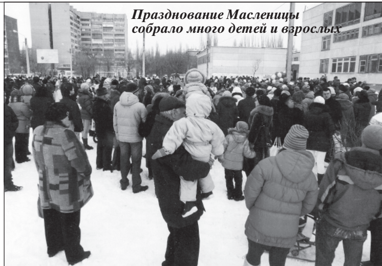
Празднование Масленицы собрало много детей и взрослых

В бюджет города были включены средства на ремонт расположенных в 6-м округе библиотек №№ 28, 29 и 46, открылась