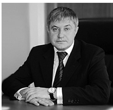
Бизнесмены и лоббисты знают, с кем иметь дело

Анализируя специфику регионального лоббизма эксперты выделяют и то, что в Воронежской области строительство и медицина являются наиболее