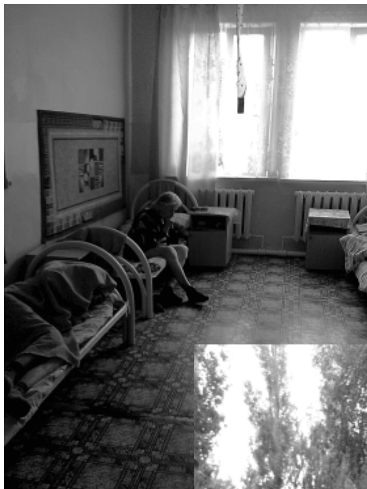
В доме для престарелых хорошо только забор, комнаты для проживающих с лентой для ловли мух производят гнетущее впечатление