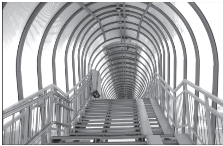
Пешеходный мост на железнодорожной станции «Губкин»