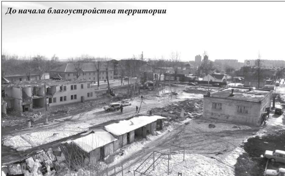
До начала благоустройства территории