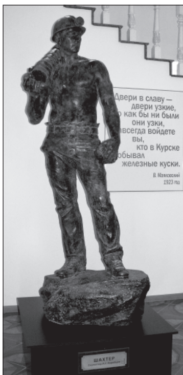
Памятник первопроходцам КМА. Скульптор – молодой губкинец Андрей Коробцов